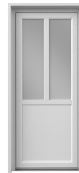
Soubassement & meneau