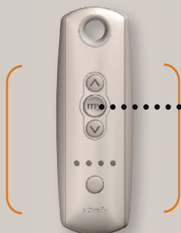
TELIS 4 RTS SILVER