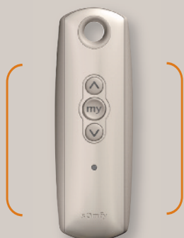
TELIS 1 RTS SILVER